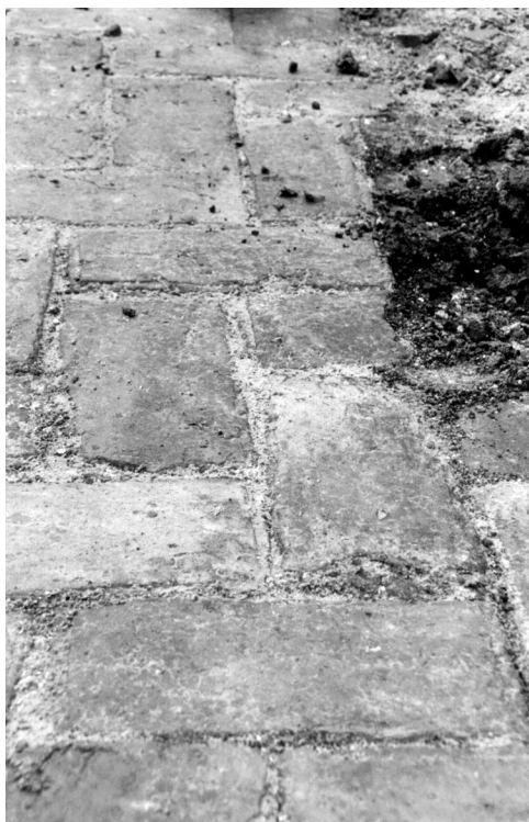
De keatsfliet bestiet út ditsoarte stiennen, saneamde rooswinkels. Foto fan de troch it brûken ôfsliten boppekant.

lenden lûke kinnen hie. No is it terrein wer igaal makke, om de ûndergrûn te foarmjen fan nije apparteminten, mei dêrûnder in parkearkelder foar de bewenners. Dat it yn sa'n gefal ek oars kin, is yn Perugia (Umbrië, Italië) te sjen. Ek dêr moast in parkearkelder komme. Restanten fan in 18de-iuske keatsmuorre binne doe lykwols net opropme, mar as monumint oanmurken.