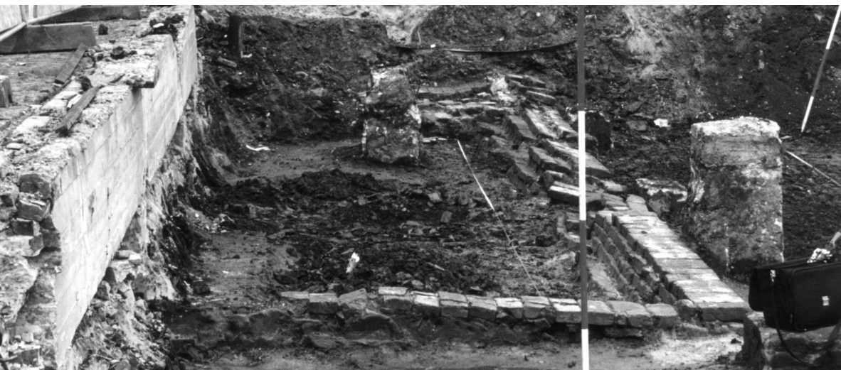
Part fan de achtergevel fan de keatsbaan. It fierste stik is fersakke, dat op 'e foargrûn is letter wer rjochtset. It muorke hielendal foaroan foarme de skieding tusken lettere keammerkes. De nei alle wierskyn noch bewarre bleaune foargevel leit ûnder de strjitte en is net opgroeven.

It is spitich dat alle resten fan de keatsbaan opromme binne. Der hie in prachtich argeologysk monumint fan te meitsjen west, dat mei in goede presintaasje hieltiten op 'en nij belangstel-