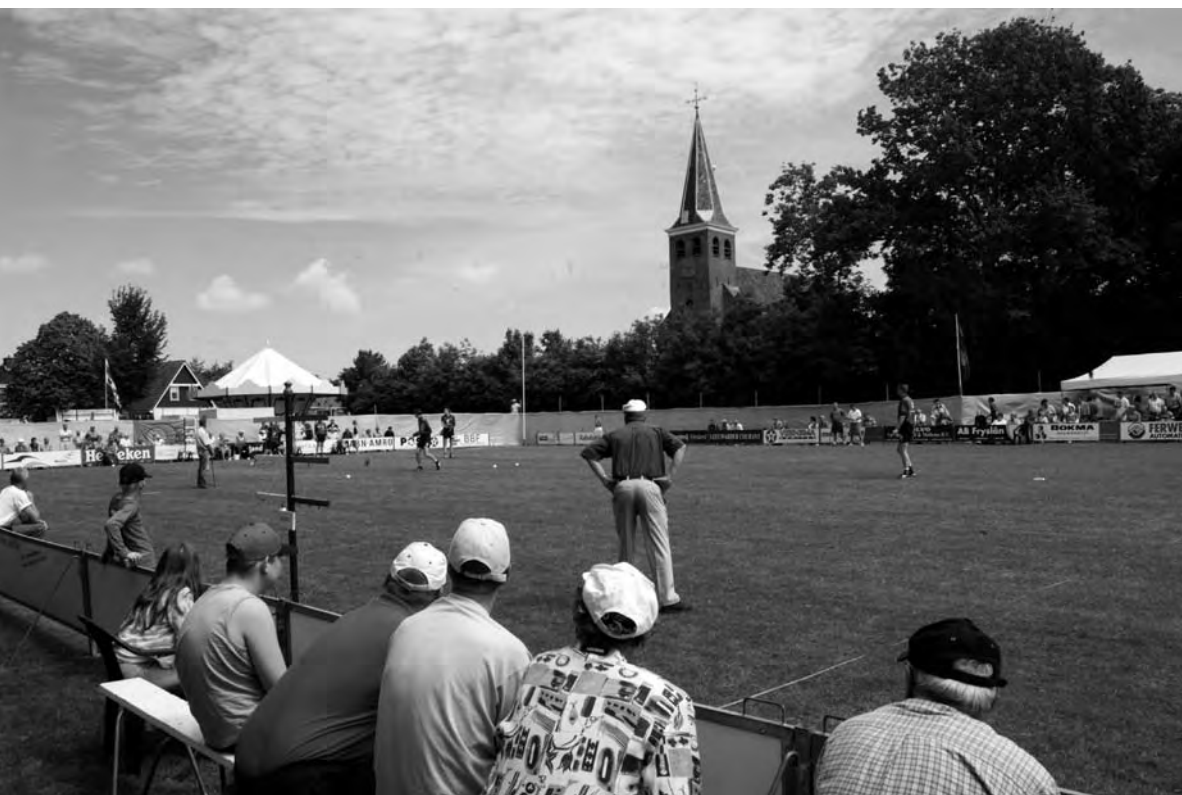
Ek sneinspartijen garandearje net altiten bergen publyk (Doanjum, 2005).

Seizoen 2005 wie it seizoen fan Chris Wassenaar. Troch it grutte tal blessueres en it bylotsjen duorren de wedstriden te lang. Foar de keatsers kin it net goed wêze om geregeld twa dagen achter inoar in topprestaasje leverje te moatten. As de sneonspartijen noris op it langst fan de dagen op woansdei fanôf 17.00 oere ferkeatst wurde en de sneinspartijen om 13.00 oere begjinne, dan soe der foar de keatsers “lucht” komme en it keatsen foar it publyk oantrekliker wurde.