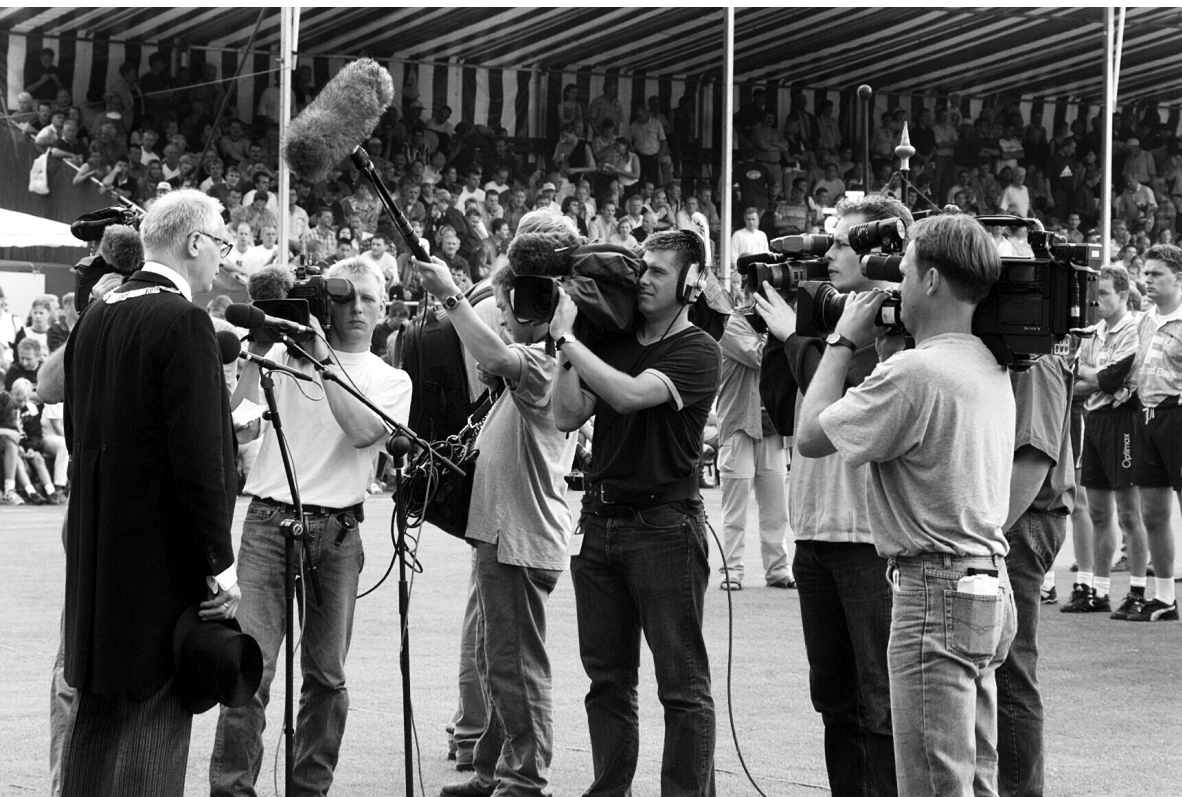
PC 2002.

In moai foarbyld is it reedriden. Yn in griis swart-wyt ferline krigen jo inkeld mar de earste en lêste hûndert meters yn byld, no wurde de riten yntegraal folge, mei help fan sels-meiridende kamera's. Wat mear rûntsjes riden wurde, wat mear profyt de sponsor hat fan syn reklame.