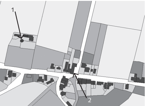
Kadastrale kaart fan Bitgum út 1832. Pylk 1 wiist nei it plak fan de mole, pylk 2 nei de herberch.